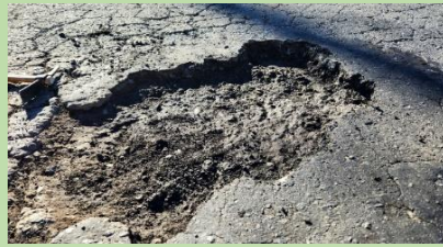
ポットホール 常温合材で補修