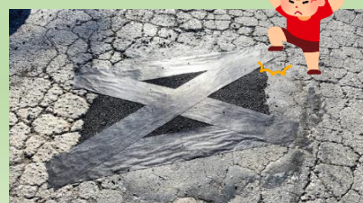
斜めに2本 しっかり踏んで 完成