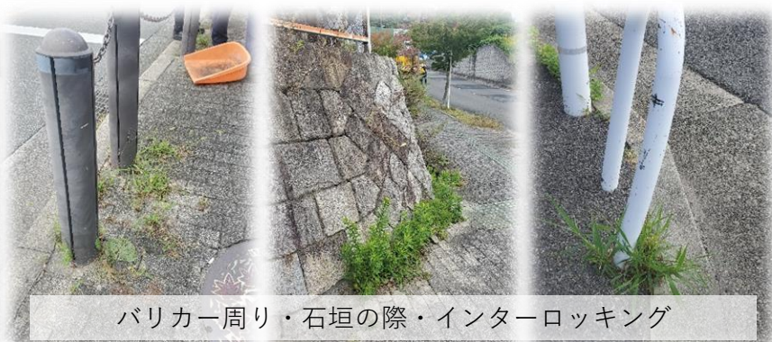
バリカー周り・石垣の際・インターロッキング