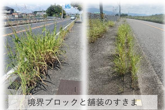
境界ブロックと舗装のすきま